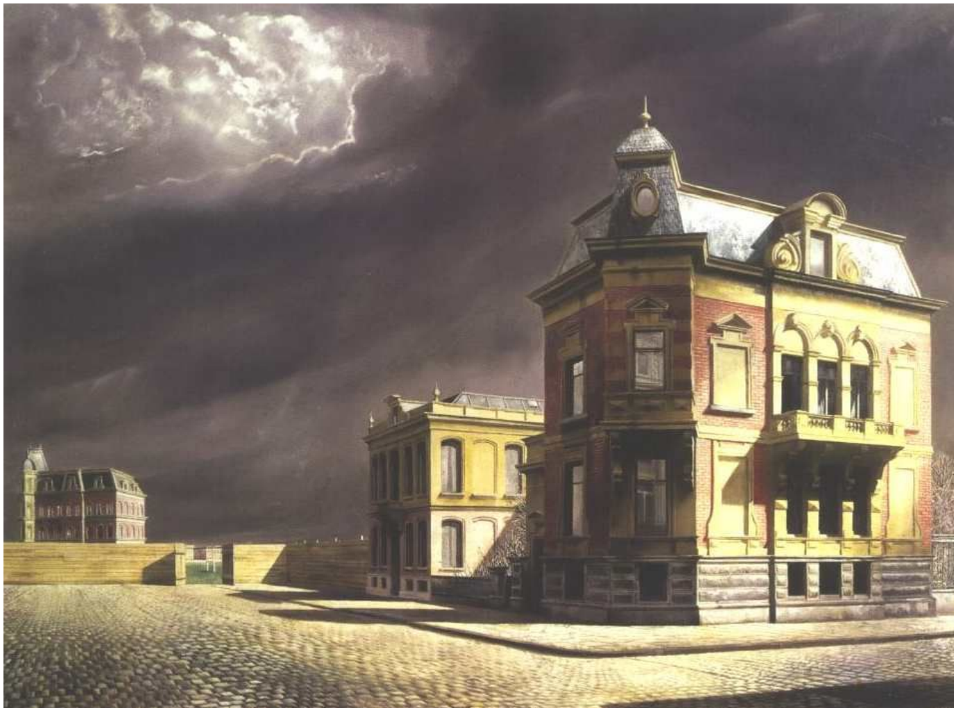
Karel Willink, schilder Magisch realisme